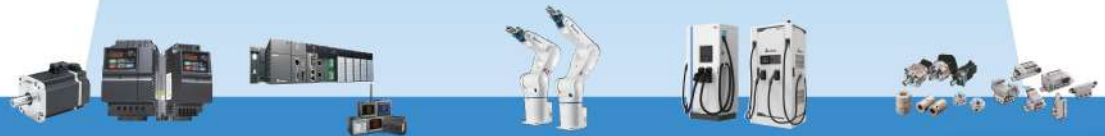
伺服 & 變頻